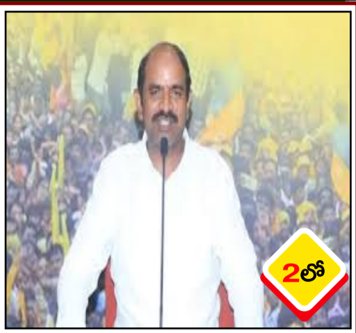
వైసీపీ అసత్య ప్రచారం.. వారి

దిగజారుడుతనానికి నిదర్శనం: ఎంపీ కలిశెట్టి