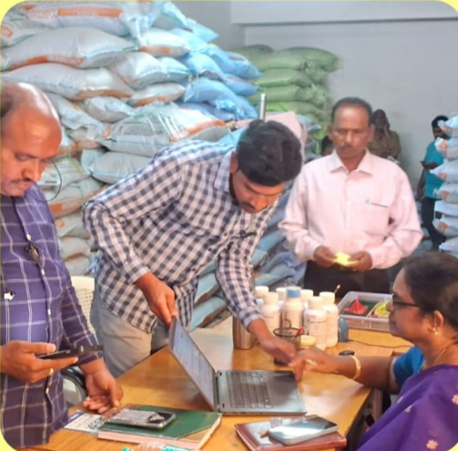
శాఖ అధికారులు, రైతు సేవా కేంద్రాల సిబ్బంది, పాక్స్ ప్రతినిధులు మరయు ఎరువుల డీలర్లు పాల్గొన్నారు.