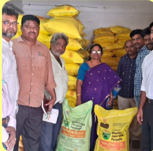
కొరత లేదని, అవసరమైన మేరకు నిల్వలు అందుబాటులో ఉంచినట్లు పేర్కొన్నారు. ఈ కార్యక్రమంలో సంబంధిత వ్యవసాయ