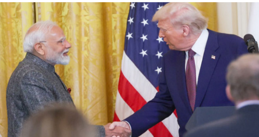
గతేదాది వారిద్దరి మధ్య తలెత్తిన విభేదాల తర్వాత ఇప్పుడు మళ్ళీ వారిద్దరూ ముఖాముఖి కలుసుకునే అవకాశం కనిపిస్తోంది. ఫ్రాన్స్ లో వచ్చే నెలలో జరగనున్న జీ7 శిఖరాగ్ర సదస్సు - మిగతా 2 లో