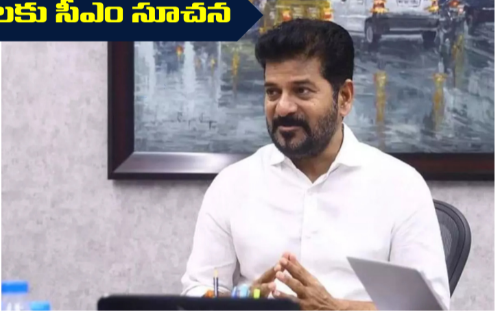
హైదరాబాద్ : తెలంగాణలో రోజురోజుకూ ముదురుతున్న ఎండల తీవ్రత, వడగాడ్పులపై ముఖ్యమంత్రి రేవంత్ రెడ్డి తీవ్ర ప్రభుత్వ యంత్రాంగాన్ని ప్రజలను అప్రమత్తం చేశారు.