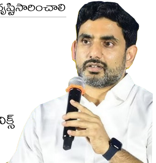
అమరావతి : "దేశానికే ఆదర్శంగా ఆంధ్ర మోడల్ ఎడ్యుకేషన్ ఉండాలన్నది నా ధ్యేయం. అందుకు అనుగుణంగా విద్యావ్యవస్థను తీర్చిదిద్దేందుకు కృతనిశ్చయంతో ఉన్నాను. అంతర్జాతీయస్థాయి అత్యుత్తమ బోధనా వద్దలపై అధ్యయనానికి ఉపాధ్యాయులను విదేశాలకు పంపుతున్నాం. ఆంధ్ర వారు తెలుసుకున్న మంచి బోధనా వద్దలను రాష్ట్రంలో అమలు చేస్తాం" అని విద్య, ఐటీ, ఎలక్ట్రానిక్స్ శాఖల మంత్రి నారా లోకేశ్ పేర్కొన్నారు. అమరావతి సవిధాలంలో రాష్ట్రవ్యాప్తంగా డీఈవోలు, ఏపీసీలతో(ఆడిషన్ లో ప్రాజెక్ట్ కోఆర్డినేటర్స్) మంత్రి సుదీర్ సమీక్షా సమావేశం నిర్వహించారు. ఈ సందర్భంగా మంత్రి లోకేశ్ మాట్లాడుతూ, క్వాలిటీ మెరుగుపరచుకోవే నష్టపోయేది పిల్లలే అన్నారు. ప్రభుత్వ విద్యావ్యవస్థ ఓపెన్ మార్కెట్ తో పోటీపడాలన్నారు. ఇందుకోసం అందరం కలిసికట్టుగా పనిచేయాలని సూచించారు. క్షేత్రస్థాయిలో వాస్తవాలను - మిగతా 2 లో