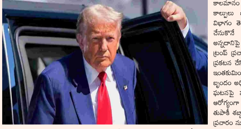
అమెరికా మాజీ అధ్యక్షుడు, రిపబ్లికన్ పార్టీ అధ్యక్ష అభ్యర్థి డొనాల్డ్ ట్రంప్ పై ఇదీవల ఫిలిడెల్ఫియాలో హత్యాయత్నం జరిగిన విషయం తెలిసింది. ఆ ఘటనను మరచిపోకముందే మరో హత్యాయత్నం ఘటన కలకలం రేపింది. ఫ్లోరిడాలోని వెస్ట్ ఫామ్ బీచ్ ప్రాంతంలో ఉన్న ట్రంప్ ఇంటర్నేషనల్ గోల్ఫ్ క్లబ్ సమీపంలో కాల్పులు ఘటన సంచలనం సృష్టించింది.

కాలమానం ప్రకారం రాత్రి 11.30 గంటలు) ఈ కాల్పులు జరిగినట్లు అమెరికా సీల్డ్ సర్వీస్ విభాగం తెలిపింది. అయితే, ట్రంప్ ను లక్ష్యంగా చేసుకొనే ఈ కాల్పులు జరిగాయి.. లేదా.. అప్పటినుండి స్పష్టత లేదని పేర్కొంది. మరోవైపు ట్రంప్ ప్రచార బృందం కూడా కాల్పుల ఘటనపై ప్రకటన చేసింది. "ట్రంప్ సురక్షితంగానే ఉన్నాడు. ఇంతకుముందే ఇప్పుడే చెప్పలేం" అని ప్రచారం బృందం అధికారిక ప్రతినిధి స్టేట్మెంట్ వెల్లడించారు. ఈ ఘటనపై స్పందించిన ట్రంప్ తాను క్షేమంగా, ఆరోగ్యంగా ఉన్నట్లు తెలియజేశారు. తన చుట్టూ తూపాకీ శబ్దాలు వినిపించాయన్నారు. కానీ ఎన్నికల ప్రచారం నుంచి తనను ఎవరూ ఆపలేరని అన్నారు. ఇంతకుముందే ఇప్పటికే చెప్పలేం" అని ప్రచారం బృందం అధికారిక ప్రతినిధి స్టేట్మెంట్ వెల్లడించారు. ఈ ఘటనలో ఒకరు ప్రాణాలు కోల్పోగా, మరో ఇద్దరు గాయపడ్డారు. దాడి చేసిన వ్యక్తిని 20 ఏళ్ల థామస్ మాథ్యూ క్రూక్స్ గా గుర్తించారు. అతను దాడి జరిగిన కొద్దిసేపటికి సీల్డ్ సర్వీస్ స్పీడర్లచే చంపబడ్డారు. దాడి నుంచి ట్రంప్ త్వరితగతిన తప్పించుకోగా, చెకి బల్లెట్ గాయం తగిలింది.