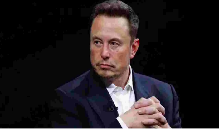
మాజీ అధ్యక్షుడు డొనాల్డ్ ట్రంప్ కు మారుడు ట్రంప్ జూనియర్, ట్రంప్ బయలుదేరే ప్రాంతానికి చాలా దగ్గరగా పార్కులో అధికారులు 47 రైఫిల్స్ కూడా కనుగొన్నారు చెప్పారు. ఆ తర్వాత ఫ్లోరిడాలోని వైస్ పామ్ బీచ్ లో ట్రంప్ గోల్ఫ్ కోర్స్ లో కాల్పులు జరిగాయి. అక్కడీ లా ఎన్ ఫోర్స్ మెంట్ ప్రకారం పార్కులో 9% కంటే ఎక్కువగా పోలీసులు పేర్కొన్నారు. పెన్సిల్వేనియాలో ఎన్నికల రాల్పిలో

అమెరికా మాజీ అధ్యక్షుడు డొనాల్డ్ ట్రంప్ పై హత్యాయత్నం ఘటనపై స్పందించిన ప్రముఖ బిలియనీర్ ఎలాన్ మస్క్ వివాదాస్పద వ్యాఖ్యలు చేశారు. అమెరికా అధ్యక్షుడు జో బైడెన్, వైస్ ప్రెసిడెంట్ కమలా హారిస్ పై హత్యాయత్నం ఎందుకు జరగడం లేదని ఆయన సోషల్ మీడియా ఎస్టి పేజీకా ప్రస్తావించారు. అయితే అదివారం ట్రంప్ గోల్ఫ్ ఆడుతున్న ఫ్లోరిడాలోని గోల్ఫ్ కోర్స్ వెలుపల కాల్పులు జరగడంతో రెండో హత్యాయత్నంగా చెబుతున్నారు. ఈ నేపథ్యంలో ఫ్లోరిడాలో ట్రంప్ పై హత్యాయత్నం జరిగినట్లు ఎఫ్ బీఐ పేర్కొంది. దీంతో రిపబ్లికన్ ప్రెసిడెన్షియల్ పలు జెస్టిఫైలు ఆయన సురక్షితంగా ఉన్నారని తెలిపాయి. డొనాల్డ్ ట్రంప్ పై జరిగిన ఘోరమైన దాడి తర్వాత ప్రముఖ బిలియనీర్ ఎలాన్ మస్క్ అభ్యర్థకరమైన రియాలిటీ ఇచ్చారు. డొనాల్డ్ ట్రంప్ పై వరే పతే దాడి జరుగుతుందా, కమలా హారిస్, జో బిడెన్ పై దాడి చేయడానికి ఎవరూ ప్రయత్నించడం లేదని మస్క్ అన్నారు. మస్క్ ఈ వ్యాఖ్యపై విచారం రేగుతోంది. ఈ క్రమంలో ఎలాన్ మస్క్ డొనాల్డ్ ట్రంప్ కు మద్దతుదారుగా ఉన్నారని అనేక కామెంట్లు వస్తున్నాయి. ట్రంప్ విషయంలో మస్క్ తరచుగా సోషల్ మీడియాలో పోస్టులు చేస్తున్నారని అంటున్నారు. మస్క్ వ్యాఖ్యలు చేయడం ప్రస్తుతం చర్చనీయాశంకగా మారాయి. దీనిపై పలువురు ట్రంప్ మద్దతుదారులు ఆయనకు అనుకూలంగా పోస్టులు చేస్తుండగా, మరికొంత మంది మాత్రం విమర్శిస్తున్నారు. అమెరికా