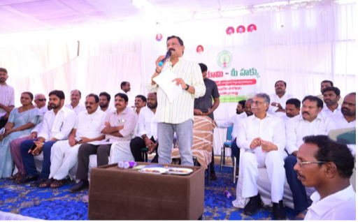
రూ.700 కోట్ల ప్రచారం ఖర్చుతో రెండు మెడికల్ కాలేజీల నిర్మించవచ్చు పాస్ బుక్ ల పంపిణీ