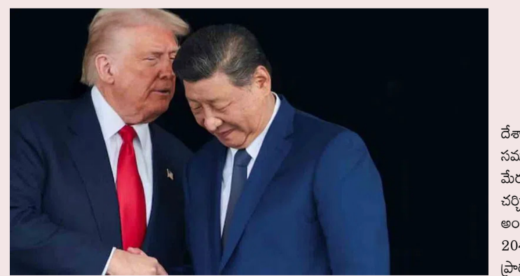
సందర్భంగా జీన్ పింగ్ పై ట్రంప్ ప్రశంసలు కురిపించారు. ఆయన ఓ గొప్ప నేత అని కొనియాడారు. ఆయనకు 108 వై మార్కులు ఇవ్వాలని ట్రంప్ వ్యాఖ్యానించారు.

అగ్రరాజ్యం అమెరికా, చైనా మధ్య వాణిజ్య యుద్ధం కొనసాగుతున్న వేళ కీలక పరిణామం చోటా చేసుకుంది. ఇరు దేశాల అధినేతలు భేటీ అయ్యారు. దక్షిణ కొరియా వేదికగా చైనా అధ్యక్షుడు జిన్ పింగ్ అమెరికా అధ్యక్షుడు డొనాల్డ్ ట్రంప్ సమావేశం అయ్యారు. ఈ సందర్భంగా చైనాకు ట్రంప్ గుడ్ మ్యాన్స్ చెప్పారు. చైనాపై విధించిన టాలిఫేలను 10శాతం మేర తగ్గిస్తున్నట్లు ప్రకటించారు. బుసానోలో దాదాపు రెండు గంటల పాటు జరిగిన భేటీలో పలు అంశాలపై ఇరువురూ చర్చించారు. ఇక భేటీ అనంతరం ట్రంప్ మాట్లాడతూ.. జిన్ పింగ్ తో సమావేశం అద్భుతంగా జరిగిందని తెలిపారు. అనేక అంశాలపై చర్చించినట్లు చెప్పారు. ఈ సందర్భంగా ట్రంప్ కీలక ప్రకటన చేశారు. ఫెబ్రవరిలో పేరుతో చైనాపై విధించిన 20శాతం సుంకాలను 10శాతానికి తగ్గిస్తున్నట్లు ప్రకటించారు. ఇక ఈ భేటీలో సోదామీన్ కొనుగోళ్లను తిరిగి ప్రారంభించడం, అరుదైన ఖనిజాల ఎగుమతికి సంబంధించిన సమస్యల పరిష్కారమైట్లు ట్రంప్ తెలిపారు. ఈ