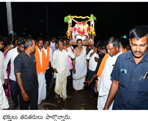
సెక్షన్ కాలనీ వైఎస్ఆర్స్ నాయకులు, కార్యకర్తలు ఆభిమానులు భక్తులు తదితరులు పాల్గొన్నారు.